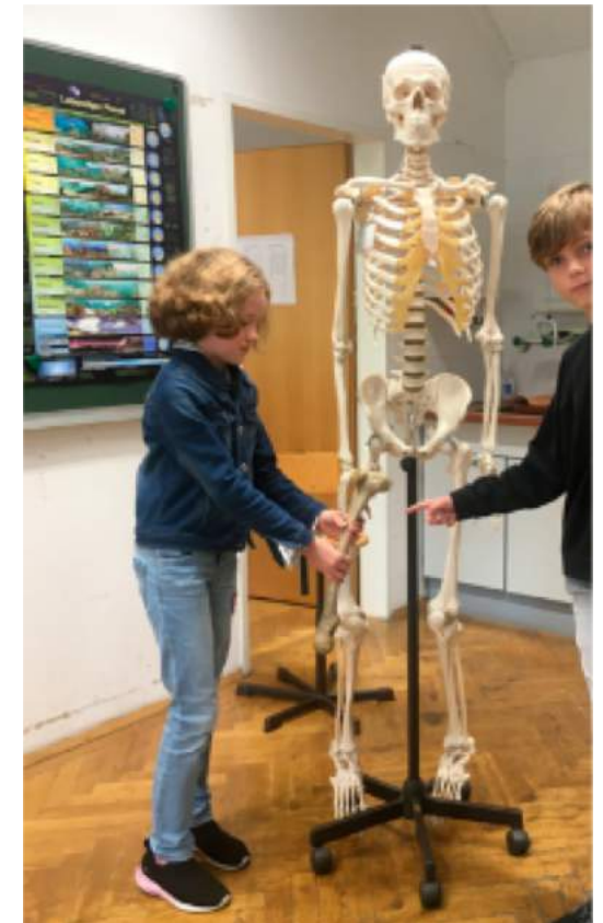
Dir. in Mag. a Elisabeth König-Hackl