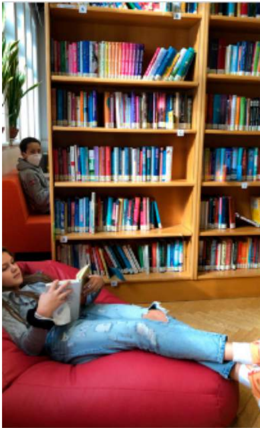
Tag der Online-Tür